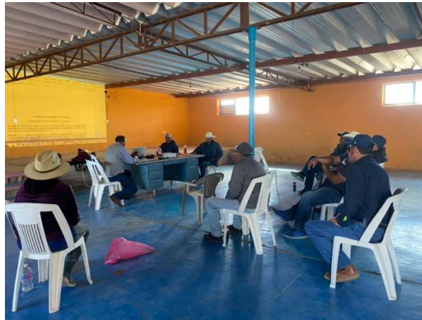
Figura 4. Capacitación a productores.