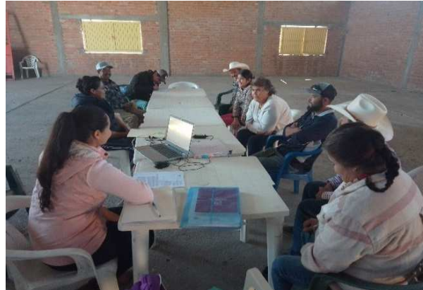
Figura 2. Capacitación a directivos de la UR.

Se hace un diagnóstico de la situación actual de once aspectos de lo que se tiene y lo que debe tener: