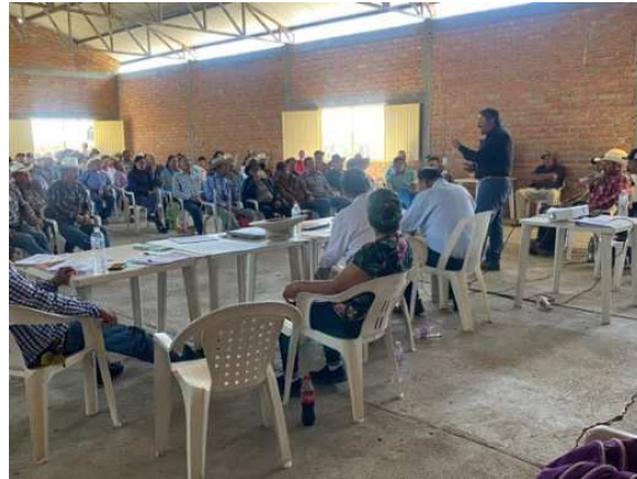
Figura 1. Presentación de proyecto a usuarios y directivos de las UR.

empresa ATL Estudios y Proyectos, S. A. de C. V., apoyará a la Dirección Local Zacatecas de la CONAGUA a llevar el proyecto para la organización de la Asociación de Usuarios, se les expuso los objetivos del proyecto y lo que se pretende lograr.