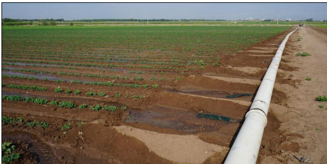
Figura 2. Arial 11, Centrada