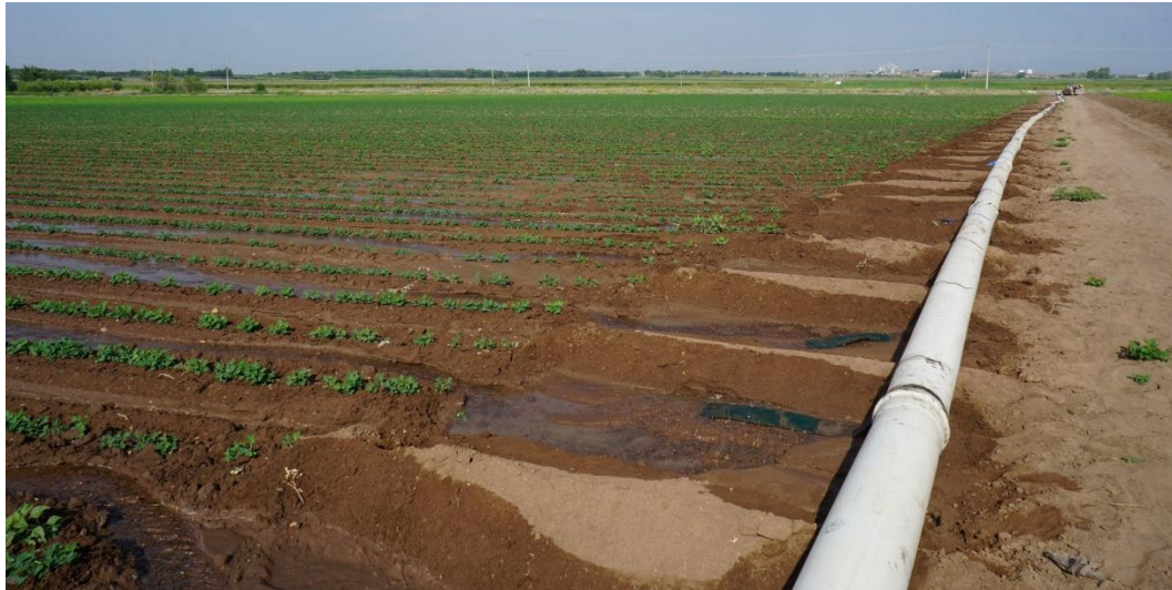
Figura 2. Aerial 11, centrada.