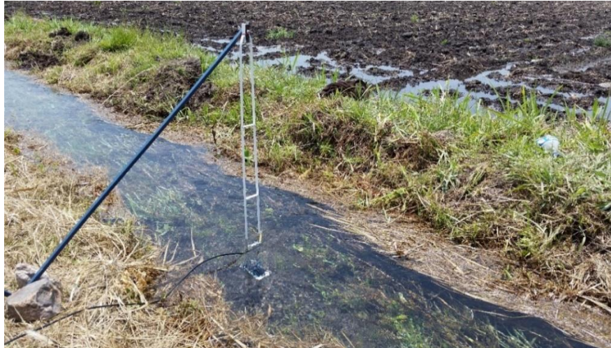
Figura 2. Aerial 11, centrada.